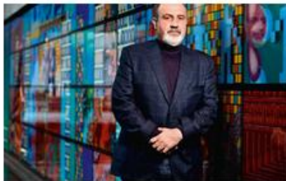
美国经济学家塔勒布 英裔美国诗人奥登